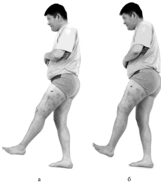
Рис. 3. Фото больного до лечения с разгибанием и сгибанием в коленном суставе

Пациентам с рецидивирующим вывихом надколенника легкой степени с хорошей функцией коленного сустава для устранения вывиха достаточно рассечения фиброзной капсулы и наружной поддерживающей связки надколенника и укрепления этих структур с его внутренней стороны. При имеющихся деформациях в нижней трети бедренной кости их можно устранить одновременно посредством надмышечковой остеотомии.