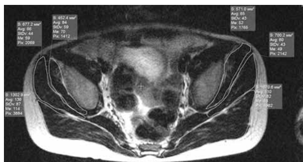
Рис. 2. МР-томограмма тазобедренных суставов больного И., 8 лет. Болезнь Легга-Кальве-Пертеса, 2 ст. t2-tse, аксиальная плоскость. Измерение площади большой, средней и малой ягодичных мышц. Справа площадь малой ягодичной мышцы меньше на 20,8 %, средней – на 3,3 %, большой – на 22,1 %

При изучении мышц в коронарной плоскости, как правило, отмечалось уменьшение длины средней и малой ягодичных мышц. Длина малой ягодичной мышцы во всех случаях изменялась по сравнению с контралатеральной стороной на большую величину, чем средней ягодичной мышцы. В представленном на рисунке 3 примере длина средней ягодичной мышцы слева (на стороне патологических изменений головки бедренной кости) была меньше на 14,0 %, малой – на 31,4 %. Изменение длины связано с гипотрофией и укорочением мышц.