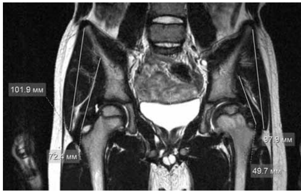
Рис. 3. МР-томограмма тазобедренных суставов больного М., 5 лет. Болезнь Легга-Кальве-Пертеса, 3 ст. Т2-ВИ, коронарная плоскость. Измерение длины средней и малой ягодичных мышц