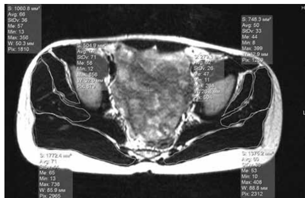
Рис. 1. МР-томограмма тазобедренных суставов больного М., 5 лет. Болезнь Легга-Кальве-Пертеса. T2-ВИ, аксиальная плоскость. Измерение площади и относительной плотности ягодичных мышц

ности распределения выборки использовали критерий Шапиро-Уилка. При нормальном распределении количественных показателей использовался t-критерий Стьюдента. В остальных случаях использовали непараметрические методы (критерий Манна-Уитни, критерий Вилкоксона). Принятый уровень значимости – 0,05. Работа выполнена в рамках сплошного ретроспективного одноцентрового исследования.